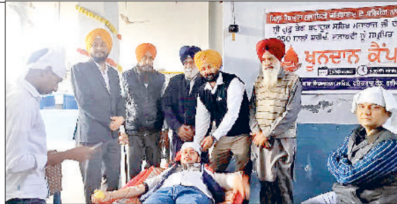
रतिया। शिविर में रक्तदान करते युवा।