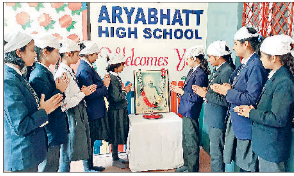
फतेहाबाद। आर्यभट्ट स्कूल में श्री गुरु तेग बहादुर जी के शहीदी दिवस पर नमन करते बच्चे।