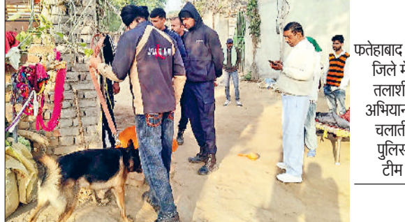
फतेहाबाद। जिले में तलाशी अभियान चलाती पुलिस टीम।