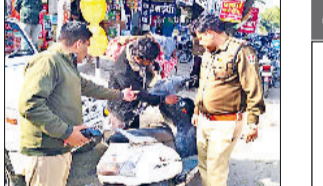
सिरसा। वाहनों की जांच करते हुए पुलिसकर्मी।