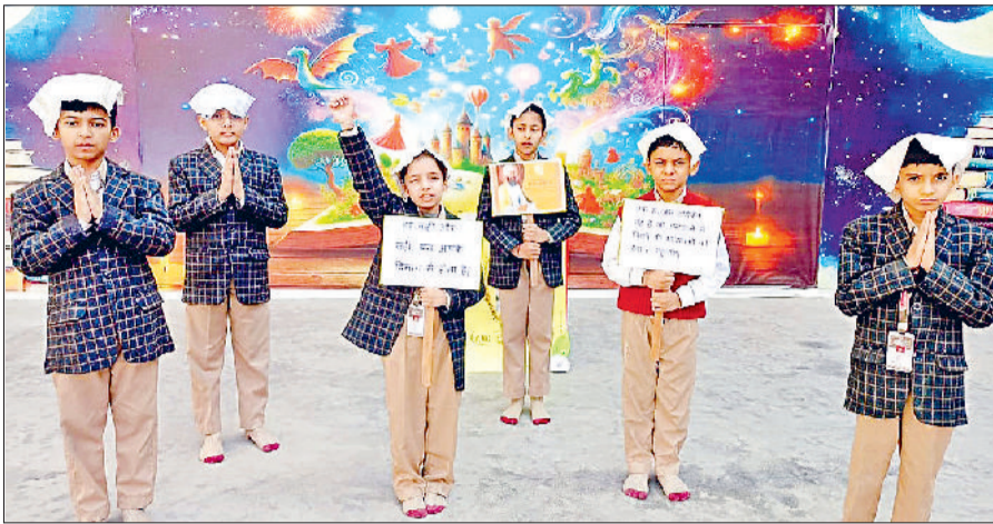
फतेहाबाद। क्रेसंट स्कूल में आयोजित कार्यक्रम में प्रस्तुति देते विद्यार्थी।

कार्यक्रम में विद्यार्थियों द्वारा गई 'हे राम, हे राम' की प्रार्थना ने वातावरण में आध्यात्मिक सौम्यता भर दी।